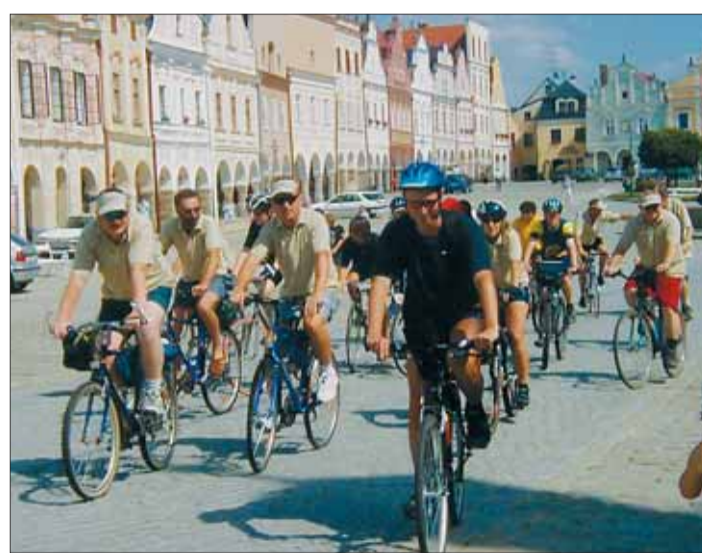
Cykloturistika je na Vysočině stále populárnější.